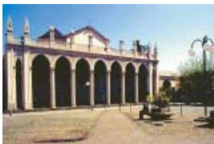
Caligaris &amp; Lupi

Alle origini del Duomo di Biella è l'antico complesso plebano di S. Stefano, comprendente anche l'antica chiesa di Santa Maria e il Battistero, secondo la struttura archetipica dei coevi complessi gallici dedicati a Saint-Etienne: un insieme di tre templi, dei quali uno consacrato al protomartire, un altro a S. Giovanni Battista ed un terzo, mariano. Il campanile di S. Stefano, che culmina in una piramide ornata da quattro pinnacoli in cotto, costituisce il lascito più consistente di un castrum medioevale. Reperti provenienti dall'antica chiesa di S. Stefano sono conservati al Museo del Territorio: un archivolto romanico-lombardo e capitelli rinascimentali. Tornando alla cattedrale, chiamata nelle antiche carte " Sancta Maria in plano ", distinta dall'oropense Sancta Maria in montibus , la lapide murata nella parete di fondo data la fondazione al 1402. Questa preziosa pergamena archeologica è un'ulteriore testimonianza dell'adesione biellese al culto mariano: il giglio a tre petali in calce all'epigrafe è infatti un simbolo cristiano che allude alla verginità di Maria, intatta prima, durante e dopo la nascita di Cristo. Al 1772 risale l'attuale consacrazione a Maria SS. Assunta e a S. Stefano. L'innovazione più recente è costituita dal portico neogotico (con ornamentazione anche di ascendenza egizia) realizzato dal biellese F. Marandono nel 1824-26. La pianta è a croce latina, a tre navate, con cupola ottagonale. Il susseguirsi degli interventi ha prodotto un